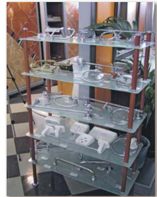
...sowie Accessoires schmücken die Ausstellung