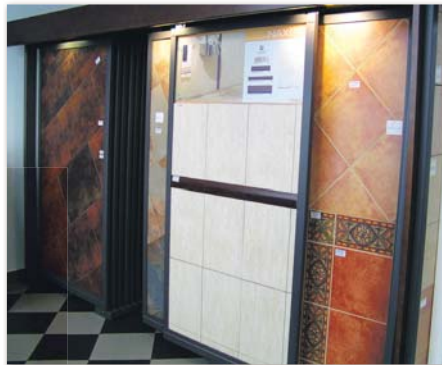
Boden- und Wandfliesen...

im Bereich der Bodenbeläge tätig und seit ca. sechs Jahren mit seiner eigenen Firma auf Erfolgskurs. Das "Abama Golf Hotel" in Playa San Juan oder das öffentliche Schwimmbad in La Mantanza sind nur einige seiner zahlreich vorhandenen Referenzen. Die Auswahl ist groß, bekannte Markenhersteller wie Alcalagres, Rosagres, Undefasa im Fliesenbereich, ROCA für Bad und WC und die legänderen Dachziegel von "La Escandelia" (die übrigens auch Lieferant für PALM SPRINGS in Dubai sind) sind