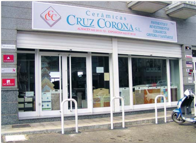
Das Geschäft ist im Zentrum von La Mantanza auf der Hauptstraße zu finden