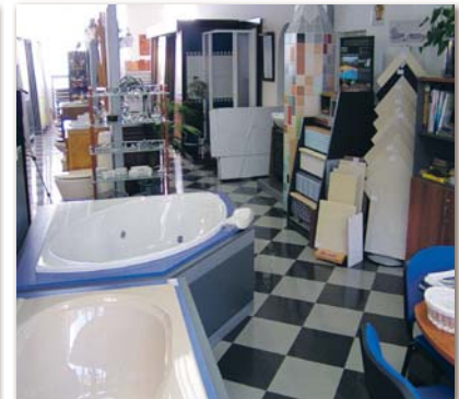
...Bad- und WC-Einrichtungen...

ein Muss für Don Pedro. Der Hersteller Technokolla aus Italien bietet die Technik für altbekannte Probleme wie undichte Dächer und Schwimmbäder. Rustikale Bodenbeläge, Porzellanfliesen für Wand und Boden sowie Armaturen fürs Bad sind in den Ausstellungsräumen von Cruz Corona in der Carretera General Del Norte 82 in La Mantanza zu finden.