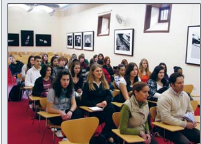
Deutsche und kanarische Schüler lernen voneinander

Die Oberstufe der Schule „IES Garachico Alcalde Lorenzo Dorta“ (Instituto de Educación Secundaria) begrüßte kürzlich zum ersten Mal 17 deutsche Schüler von der „Ziehenschule“ aus Frankfurt am Main.