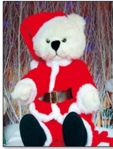
Weihnachten - ein Fest für Kinder

Weihnachtskonzerte in Santa Cruz (San Andrés, La Noria, La Salle, Avda. Anaga, parque Bulevar und calleón del Combate) von 21 bis 23 Uhr