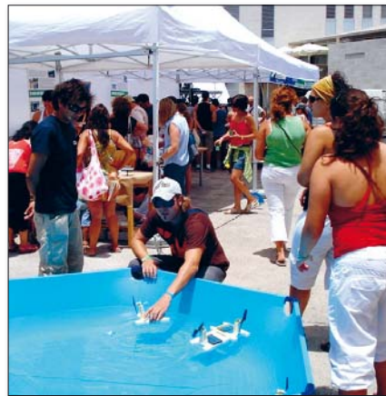
Erneuerbare Energien sind nur ein Bereich, in dem die Kanaren eine Vorreiterrolle übernommen haben

Demgegenüber müsse man aber sehen, dass die Bevölkerungsdichte auf den Kanarischen Inseln noch nie so hoch gewesen sei wie im Moment. Etwa 1.716.400 Menschen sind älter als 16 und bilden somit die aktive Bevölkerung der Inseln. Diese Zahl steigt ständig und zwar überdurchschnittlich im Vergleich zum spanischen Festland. Der positive Aspekt dabei ist, dass die Kanaren zu den