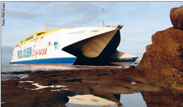
Die Fähre lief am Abend des 2. Dezembers in Los Cristianos auf Grund

Spaziergänger am Hafen von Los Cristianos trauten ihren Augen nicht: Direkt vor dem Hotel Oasis Moreque war eine Fähre auf Grund gelaufen. Anstatt an der Hafenanlage anzulegen, hatte es die Bonanza Express von Fred Olsen, deren Rückwärtsgang ausgefallen war, direkt auf den steinigen Grund getrieben. Verletzte gab es nicht, alle 172 Passagiere wurden von Rettungsbooten an Land gebracht und dort von Helfern des Roten Kreuzes empfangen.