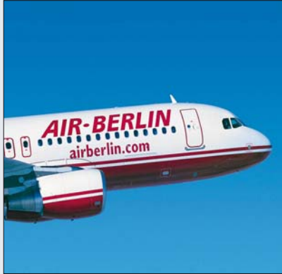
Air Berlin kürzt Kanarenflüge

Teneriffa Süd verliert in der kommenden Wintersaison rund 80.000 Passagiere von Air Berlin an Gran Canaria, weil das Kreuzfahrtschiff Aida in Zukunft von Las Palmas aus operiert.