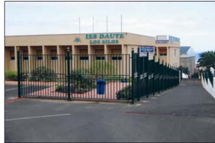
Das IES Daute war eine der wenigen Schulen, die sich fast geschlossen für den Streik entschieden hat

In der Realität sieht es jetzt so aus: Es wird Englisch ab der Vorschule angeboten und obligatorisch bis zum Abitur beibehalten. Ab der fünften Klasse kommt eine zweite Fremdsprache, in der Regel Französisch, manchmal auch alternativ Deutsch hinzu. In den beiden letzten Abiturklassen, wo die zweite Fremdsprache bisher immer als Wahlfach angeboten wurde, wurde sie zugunsten der Hauptfächer rigoros gestrichen. Auch Schüler, die in diesem Fach gut waren oder Ambitionen auf eine Karriere in der Tourismusbranche haben, wo alle Sprachkenntnisse hilfreich sind, haben künftig keine Chance mehr, ihre Kenntnisse weiter auszubauen. Parallel dazu wird aber weiterhin Religion angeboten – ein Fach, an dem die meisten Jugendlichen kein großes Interesse