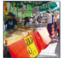
Markt in Torviscas

donnerst. 09-14 Uhr: Markt in Torviscas (Centro Comercial Duque, Costa Adeje)