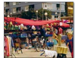
Markt in El Médano

samstags 08-14 Uhr: Markt in El Médano (Gemeinde Granadilla) auf der Haupt-Plaza