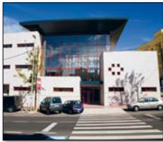
Kulturzentrum in Valle San Lorenzo

Kulturzentrum in Valle San Lorenzo Bis 29. August: Bilder von Rosa Cancellana Montag-Freitag 16-22 Uhr