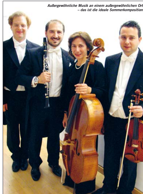
Außergewöhnliche Musik an einem außergewöhnlichen Ort – das ist die ideale Sommerkomposition

Auf dem Programm stehen das Trio für Klarinette, Cello und Piano Opus 114 von Johannes Brahms sowie das Trio Elegjaco von Sergej Rachmaninov für Violine, Cello und Piano. Eintrittskarten sind in der Casa del Vino oder über das Onlineportal der CajaCanarias für zwölf Euro erhältlich.