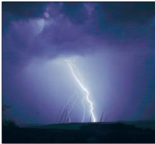
Blitze und Donner bringen den menschlichen Organismus durcheinander

Wichtig ist auch, den Biorhythmus einzuhalten. Also immer zur gleichen Zeit aufstehen und schlafen gehen.