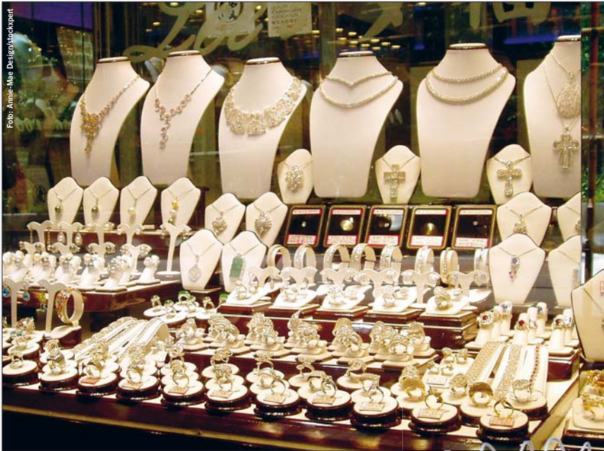
Purer Luxus zieht magisch an – für manche wird das zum Problem

Bislang wurde Kaufsucht oft verharmlost und darum nicht behandelt. Doch woran lässt sich die Sucht von der reinen Lust am Shoppen überhaupt unterscheiden? Bei näherem Hinsehen liegen die Unterschiede jedoch auf der Hand: Kaufsüchtige sind keine Schnäppchenjäger, denn der Preis spielt keine Rolle. Und sie sind auch keine Lustkäufer, weil sie keine Freude an dem Erworbenen haben. Oft landen die Sachen unausgepackt in überquellenden Schränken,