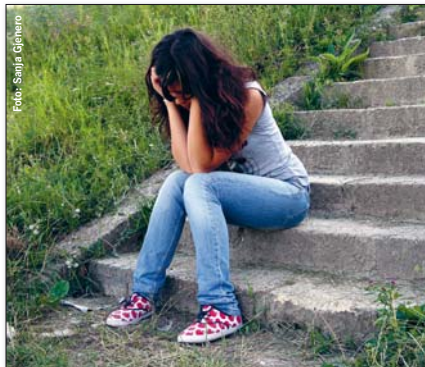
Shopping-Süchtige leiden oft unter Depressionen

betroffen; der Anteil der weiblichen Betroffenen allerdings liegt höher. Und: Jüngere Menschen verfallen schneller in dieses Suchtverhalten als ältere.