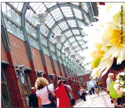
In den Einkaufsmielen locken zahllose Versuchungen

Haben Sie mehr als vier Fragen dieses Tests mit „ja“ beantwortet, sollten Sie Ihr Konsumverhalten dringend genau beobachten. ■