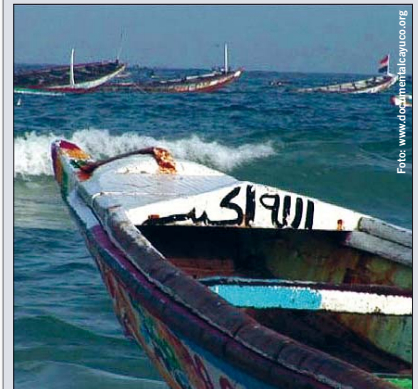
Die Cayuco-Überfahrt in Richtung Kanaren endet für viele Menschen mit dem Tod

Der Rückgang der Ankünfte wird als großer Erfolg der Grenzschutzeinheiten betrachtet. Zudem haben Beamte der Nationalpolizei und der Zivilpolizei 2008 bisher 171 mutmaßliche Schlepper gefasst, was um 55 mehr als im Vergleichszeitraum 2007 sind.