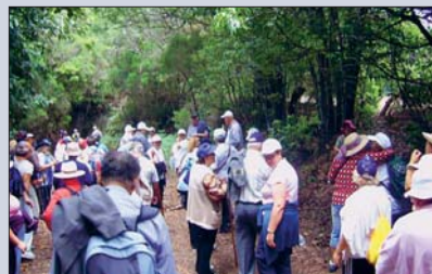
Wandern tut nicht nur dem Körper gut, sondern auch der Seele

Veranstalter ist der gemeinnützige Verein IASS (Instituto de Atención Social y Sociosanitario). Information und Anmeldung unter Tel. 922 53 26 03.