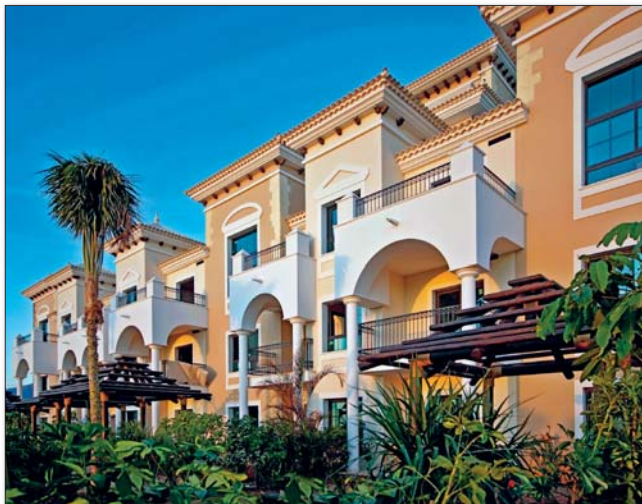
Das Hotel soll den Qualitätstourismus in der Zone beleben

Der zentrale und zugleich luxuriöseste Teil des Hotels, mit dem Namen „The Level“, besteht aus 53 Zimmern, dem Eingangsbereich und einer Empfangshalle. Außerdem gibt es unter anderem 114 Demi-Suiten (ein Mittelding aus Suite und Doppelzimmer) mit Gartenblick, 296 Demi-Suiten mit Meerblick und 49 Demi-Suiten mit