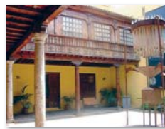
Geschichtsmuseum in La Laguna

30.5. Museumsnächte. Info 922 825 949. Geschichtsmuseum in La Laguna um 20.30 Uhr