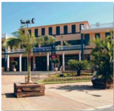
Kulturzentrum in Los Cristianos

25.5. THE FREAK BROTHERS. Mazarrihah in Tacoronte um 15.30 Uhr SWING CATS. Faro Chill Art in Costa Adeje um 19.30 Uhr Gesang und Klavier. Kulturzentrum in Los Cristianos um 20 Uhr