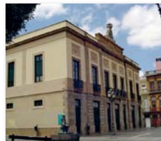
Theater Guimerá in Santa Cruz

16.5. XV. Festival de Zarzuela. Theater Guimerá in Santa Cruz um 20.30 Uhr