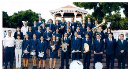
Die Kapelle „Ntra. Sra. de Los Remedios“ setzt sich derzeit aus 33 Musikern zusammen

Die anspruchsvolle Konzertreihe auf der Isla Baja geht in die nächste Runde. Dieses Mal stehen gleich drei Highlights auf dem Programm.