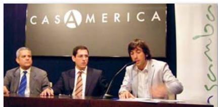
Vorstellung des Programms in Madrid