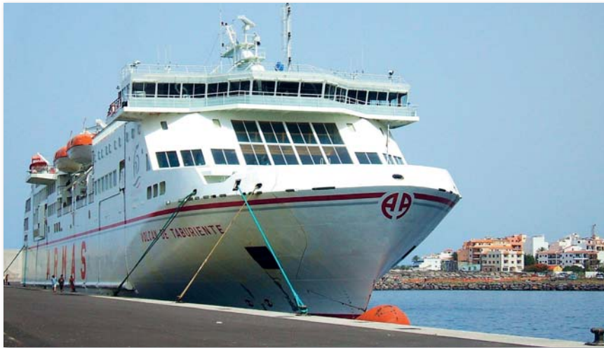
Die Reederei Naviera Armas hat eine der modernsten Schiffsflotten in Spanien

Die Volcán de Tijarafe gehört zu den Fähren der neuesten Generation, die in letzter Zeit weltweit gebaut wurden. Das 1.850 Meter lange und 300 Meter breite Schiff hat eine Transportkapazität von 630 Fahrzeugen. Wegen des vielseitigen Raum-