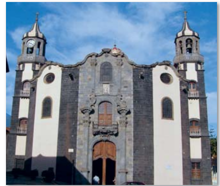
Das imposante Eingangsportal zum wichtigsten Gotteshaus La Orotava

Auch heute noch ist diese Kirche das Zentrum der religiösen Anbetung in der Stadt und Ausgangspunkt wichtiger Prozessionen im Jahresablauf. ■