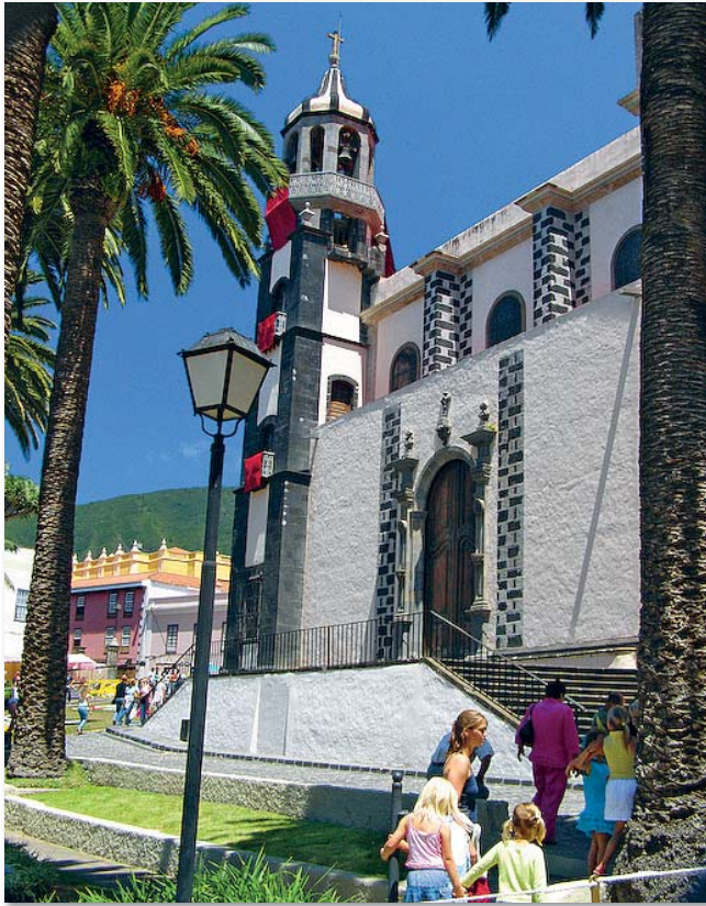
An der Mauer unter der Treppe sieht man den ehemaligen Eingang in das Friedhofsgewölbe

Die Kirche „Iglesia de la Concepción“ in La Orotava ist ein Musterbeispiel barocker Kunst auf den Kanaren. Der heutige Bau wurde im Jahr 1788 eingeweiht, der Ursprung des Gebäudes wird allerdings bis in die frühen Jahre des 16. Jahrhunderts zurückdatiert.