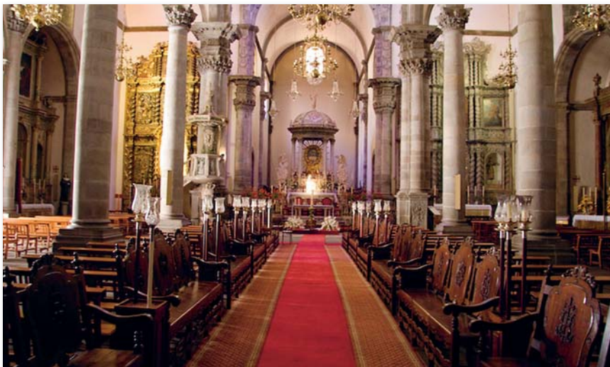
Der Innenraum der Kirche ist gefüllt mit zahlreichen Kunst- und Kulturschätzen