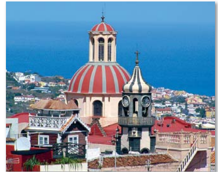
Die beeindruckende Kuppel wird von einer späteren kleinen Kuppel im Laternenstil gekrönt