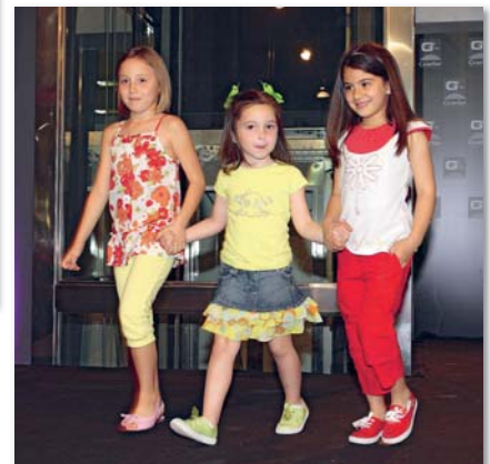
Auch kleine Models machten erste Laufsteg-Erfahrungen im Gran Sur

Sowohl den Teilnehmern als auch dem Publikum und der Jury hat der Event offensichtlich Spaß gemacht, weshalb die Geschäftsführung des C.C. Gran Sur schon jetzt verspricht, in Zukunft weitere Veranstaltungen wie diese zu organisieren.