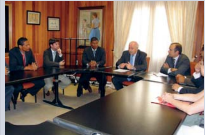
Die Repräsentanten der Kapverden bei ihrem Cabildo-Empfang