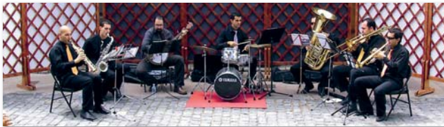
Die Tom Sawyer Dixieland-Jazzband bringt am Sonntagmittag Rhythmus nach Buenavista del Norte