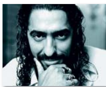
Diego el Cigala tritt im Faro Chill Art in Costa Adeje auf

Der Flamenco-Sänger Diego el Cigala meinte schon bei seinem letzten Besuch auf den Kanarischen Inseln: Er habe große Lust zurückzukommen.