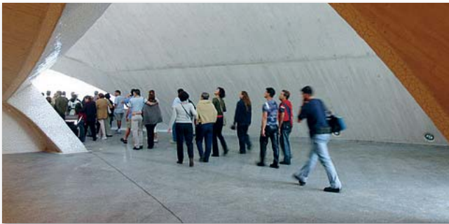
Die Veranstaltungen des Auditoriums werden immer beliebter

In den kommenden Monaten Mai, Juni und Juli wird das Auditorium von Teneriffa insgesamt 36 Konzerte und Auführungen präsentieren. Wieder wird von Jazz über Pop, Rock oder Klassik bis hin zum Tanz für jeden Geschmack etwas dabei sein.