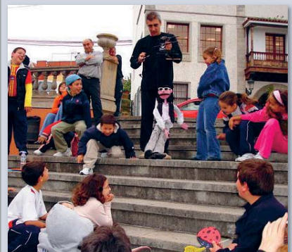
Die Marionetten-Spieler sind es gewöhnt, ihre Puppen vor internationalem Publikum tanzen zu lassen.

Das internationale Marionettenfestival der Kanaren wurde vor etwa 20 Jahren ins Leben gerufen.