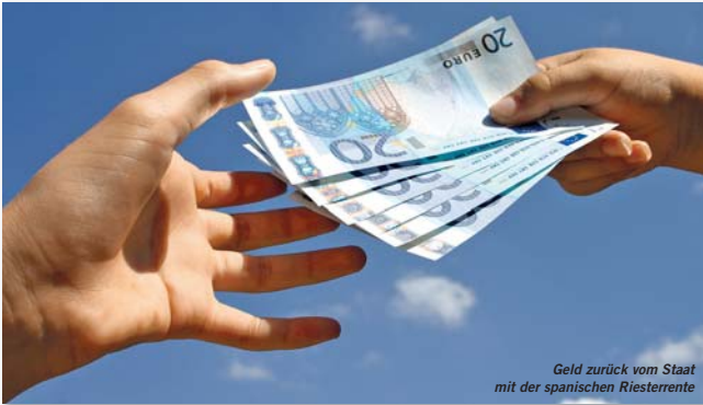
Geld zurück vom Staat mit der spanischen Riesterrente

Unglaublich aber wahr, Sie können noch bis zum 31. Dezember 2006 Ihre Steuern um bis zu € 3.600,00 reduzieren. Dazu bieten Ihnen die Banken und Versicherungsgesellschaften den Planes de Pensiones bzw. Planes de Previsión Asegurados an, welcher vergleichbar mit der deutschen Riesterrente ist.