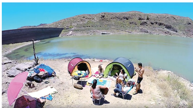
↑ Auch beim Bad im Stausee muss vorher beachtet werden, ob das Baden dort überhaupt erlaubt ist. Und niemals einen Kopfsprung machen, wenn man nicht sicher ist, wie tief das Wasser ist.