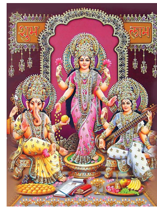
↑ Diese drei Gottheiten Ganesh, Lakshmi und Sarasvati werden an Diwali verehrt.

Viele Menschen sind keine praktizierenden Gläubigen, weil