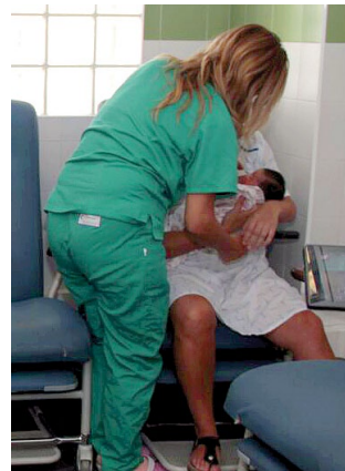
↑ Und wenn es nicht gleich klappt, helfen die Krankenschwestern und Hebammen des Hospitals José Molina Orosa auf Lanzarote gerne.

die für das Stillen sprechen. Wer stillt, hat jederzeit das Essen des Kindes griffbereit. Völlig stressfrei. Es ist immer fertig, perfekt temperiert und kann überall gefüttert werden. Außerdem ist es kostenlos. Eine junge Familie kann allein durch das Stillen in den ersten sechs Lebensmonaten rund 900 Euro sparen. Die Zusammensetzung der Muttermilch ist ideal auf die Bedürfnisse des Kindes abgestimmt und sie verändert sich je nach Alter und Wachstum des Neugeborenen ganz automatisch. Muttermilch ist reich an Vitaminen, Abwehr- und Immunstoffen sowie bakterienfrei. Gestillte Babys leiden