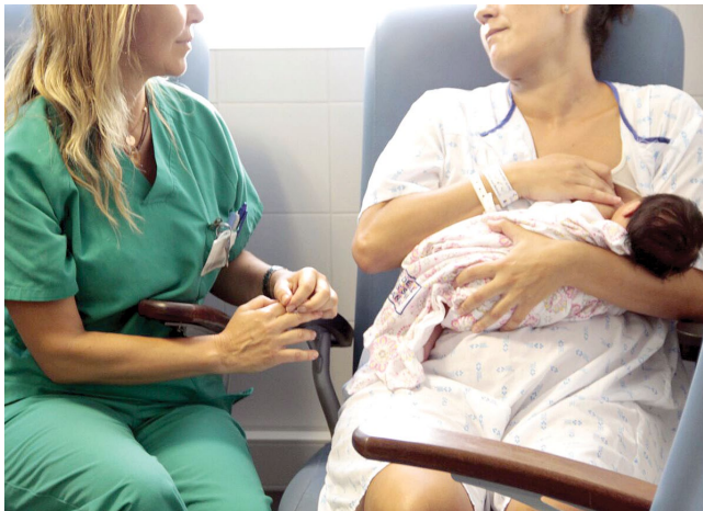
↑ Stillen beinhaltet innige Momente für Mutter und Kind. Es unterstreicht die besondere Beziehung und beide profitieren davon.

Anlässlich der internationalen Woche des Stillens sprach sich das Mutter-Kind-Krankenhaus Hospital José Molina Orosa auf Lanzarote eindeutig für das Stillen des Kindes an der Mutterbrust aus. Die Hebammen, Ärzte und Krankenschwestern dort befürworten das Stillen, aber sie gehen auch auf die Mütter, ihre Ängste und Bedenken ein.