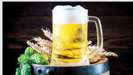
↑ Ein Prosit auf selbst gebranntes Bier.

Die Theorie wird am 28. September abends behandelt. Dort lernt der Teilnehmer, welche verschiedenen Biersorten es gibt und was sie ausmachen. Welche typischen Zutaten, Malz, Hefe und Hopfen, brauche ich und in welcher Zusammensetzung? Am zweiten Kurstag, Samstag, 30. September, geht es dann „ran ans Bierbrauen“. Einen Tag lang wird gebraut und getestet. Alle Teilnehmer erhalten eine Schritt-für-Schritt-Anleitung zur Erinnerung und dürfen natürlich auch die Erzeugnisse ihrer eigenen Braukunst mit nach Hause nehmen. Der Kurs ist offen für alle, aber begrenzt in Bezug auf die Teilnehmerzahl. In erster Linie werden junge Menschen oder Personen, die in den Nahrungsmittelbereich einsteigen wollen, bevorzugt. Anmeldungen bitte direkt an das Landwirtschaftsamt von Santa Úrsula unter der Telefonnummer 922 301 640 oder an die Email agricultura@aytosantaursula.com . ■