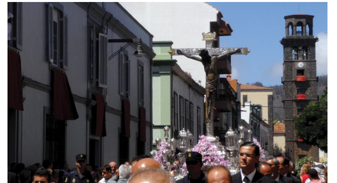
Das silberne Kreuz aus dem 17. Jahrhundert ist das Prunkstück der Kirche in La Laguna. Ein echtes Meisterwerk.

Begleitet werden sie von Fanfarenklängen, Riesen und „Großköpfigen“. Circa um Mitternacht wird von der Montaña de San Roque ein großes Feuerwerk gezündet. Am Hauptfesttag, dem 14. September, geht es eher religiös zu. Um 10.15 Uhr werden per militärischer Salve die Feierlichkeiten angekündigt. Um 10.45 Uhr empfängt Erzbischof Bernardo Álvarez auf der Plaza de la Catedral politische, militärische und gesellschaftliche Würdenträger sowie einen Repräsentanten des spanischen Königshauses. Nach der Festmesse wird das silberne Kreuz in feierlicher Prozession durch die historische Altstadt getragen. Am Abend um 19 Uhr findet eine zweite Festmesse mit Prozes-