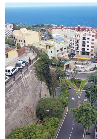
Von dieser hohen Mauer, am Rande der Stadtmitte, wollte der Lebensmüde im Tablettenrausch springen.

spürte, dass der Mann auf eine hohe Mauer am Rande der Innenstadt zulief und befürchtete das