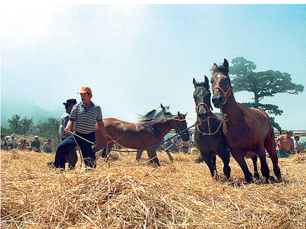
↑ Die Trilla verwendet traditionelle Erntemethoden.

erwerk begangen. Ebenfalls im September, allerdings nur alle vier Jahre, wird die Librea de Tegueste gefeiert. Sie hat ihre Wurzeln im 17. Jahrhundert in verschiedenen Traditionen zur Danksagung bei den Schutzheiligen für die Befreiung des Ortes von der Pest und dem Schutz vor den Angriffen durch Piraten. In typische Trachten gekleidete Einwohner aus Tegueste spielen Szenen aus dem ländlichen Leben und den religiösen Gebräuchen nach. Während Soldaten durch die Straßen zum Haus des Kapitäns marschieren,