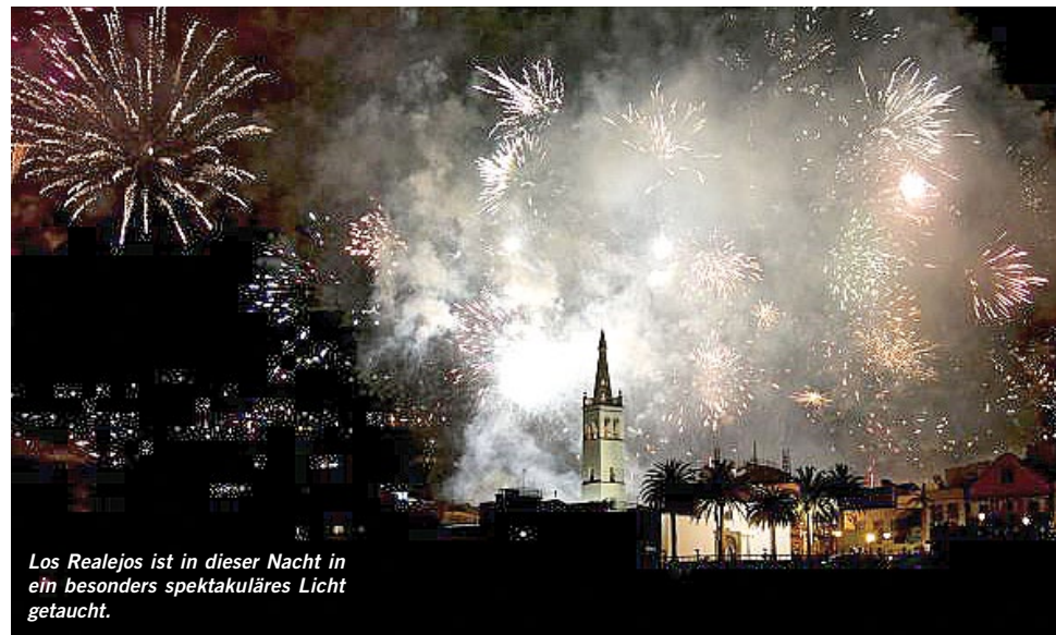
Los Realejos ist in dieser Nacht in ein besonders spektakuläres Licht getaucht.

Jeden 3. Mai wird auf Teneriffa das Fest der Kreuze gefeiert. Alle Orte, ob klein oder groß, die das Wort Cruz, also Kreuz, im Namen tragen, haben an diesem Tag einen lokalen Feiertag. So auch in Los Realejos, das dieses Fest dem Ortsteil Cruz Santa verdankt. Alle Kreuze werden mit üppiger Blütenpracht geschmückt. Und den ganzen Tag über werden für Besucher Führungen zu den einzelnen Highlights im Stadtgebiet angeboten. Über 300 geschmückte Kreuze bestimmen das Ortsbild an diesem besonderen Tag. Gleiches gilt für Santa Cruz, wo Interessierte auf den Ramblas an bunt geschmückten Kreuzen vorbeiflanieren können. Verschiedene Unternehmen, Schulen oder Verein kümmern sich um die Gestaltung. Weitere Programmpunkte zu den Fiestas de Mayo in Santa Cruz in der nächsten Ausgabe 270 oder über die Webseite www.santacruzdetenerife.es .