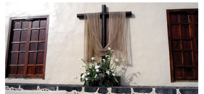
Auch in anderen Orten, wie hier in Puerto de la Cruz, wird das Fest der Kreuze gefeiert.

schmücken. Im 18. Jahrhundert kamen dann Böller und Leuchtraketen hinzu. Inzwischen gipfelt der Wettstreit in einem gewaltigen Feuerwerk, das sich, sobald es dunkel wird, in den Abendhimmel erhebt. Die beiden pyrotechnischen Betriebe, die in dieser Gemeinde beheimatet sind, liefern sich – stellvertretend für je eine Straße – ein gewaltiges Leucht-Duell. Die schönsten und tollsten Raketen steigen in den Nachthimmel auf und zaubern die prächtigsten Bilder. Nicht nur für Romantiker ist diese Nacht etwas ganz Besonderes.