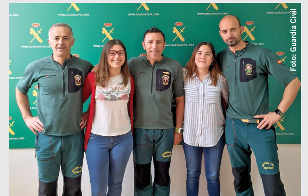
↑ Die beiden jungen Frauen mit ihren Rettern – das hätte auch schlimmer ausgehen können.

Die 23-Jährigen befanden sich auf dem oberen Teil des Weges El Rejo in der Gemeinde Hermigua. Sie hatten sich verirrt und wollten den Weg abkürzen, weil die Dunkelheit nahte. Sie selbst hatten den Notruf informiert. Doch dann wurde es dunkel und sie versuchten, geleitet von dem GPS System ihres Handys, zurück auf den Wanderweg zu gelangen. Dabei waren sie an einem steilen Abhang ins Leere getappt und rund 20 Meter tief gerutscht. Nur ein Baum, an dessen Ästen sie sich festklammerten, konnte Schlimmeres verhindern. Dennoch waren sie in einer prekären und gefährlichen Situation. Der Zivilschutz, der die beiden Frauen gefunden und sich vergewissert hatte, dass sie unverletzt waren, blieb mit den beiden in Kontakt und schickte ihnen Verpflegung. Wegen des extrem steilen Geländes und der Gefahr des Absturzes, wurde die Bergung bis zum Tagesanbruch verschoben. Zudem wurde gegen 1 Uhr die Sondereinheit GREIM der Bergwacht der Guardia Civil auf Teneriffa angefordert. Per Hubschrauber wurden sie eingeflogen. Auch das gestaltete sich aufgrund des schlechten Wetters abenteuerlich. Am Morgen wurde dank des Einsatzes von drei Bergspezialisten und von 150 Meter Sicherungsseil die Rettung der beiden jungen Frauen glücklich zu Ende gebracht. Sie waren unterkühlt und müde, aber unverletzt. ■