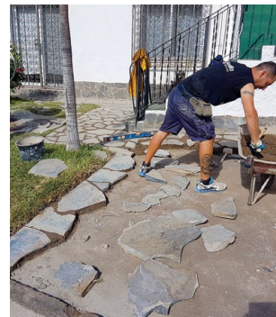
↑ Außenbereich mit Natursteinen schaffen ein rustikales und typisches Ambiente.

Umsetzung, pünktliche Fertigstellung, die Verwendung hochwertiger Materialien und Zuverlässigkeit stehen bei Ossibau ganz oben auf der Prioritätenliste. Wer sich auf den Sommer freut und sich nach einer pflegeleichten Sonnenliegewiese sehnt, die es auch verzeiht, wenn der Besitzer einfach mal für ein paar Wochen in die Heimat verschwindet, für den ist Kunstrasen eine interessante Alternative. „Ich habe den Kunstrasen jetzt schon verschiedentlich bei Kunden verlegt und alle sind mit dieser Lösung sehr zufrieden. Die Qualität eines guten Kunstrasens ist inzwischen so gut, dass er auf den ersten Blick gar nicht von einem echten zu unterscheiden ist“, weiß der Fachmann aus