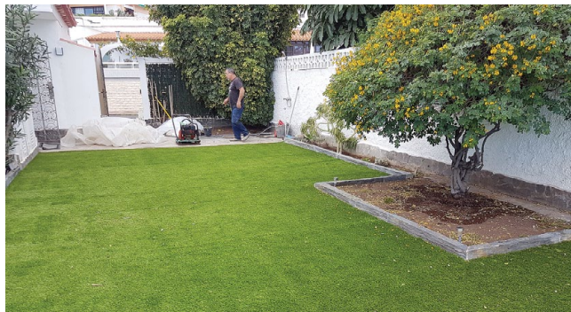
↑ Kunstrasen fachgerecht verlegt, ist eine pflegeleichte Alternative, vor allem für Hausbesitzer, die nicht immer auf Teneriffa sind.