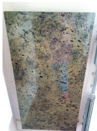
↑ Durch die individuelle Farbauswahl der Steinplatte kann die Heizung optimal dem eigenen Wohnstil angepasst werden.