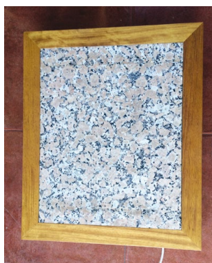
↑ Der Holzrahmen mit Granitplatte wird auf Wunsch auch auf Rollen montiert und kann so einfach von einem Zimmer ins nächste gebracht werden.

keit, sondern wirkt sich auch positiv auf die Gesundheit der Bewohner aus. Beschwerden wie Rheuma, Gelenkschmerzen und Atemprobleme werden durch die trockene Wärme gelindert. Die produzierte Strahlungswärme speichert sich in allen Materialien des Bauwerks, wie Wänden, Decken, Böden, und trocknet sie gleichzeitig aus. Dadurch verringert sich die Schimmel- und Staubbildung in den Räumen. Und noch eine positive Nebenwirkung: Mit nur einem Prozent weniger Feuchtigkeit an einer Außenwand erhöht sich deren Wärmedämmkapazität um fünf Prozent.