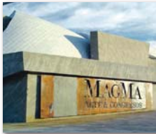
Das Magma Kongresszentrum bietet anspruchsvolle Konzertveranstaltungen

23.3. Freitag Offizielle Vorstellung des ersten Orchesters zeitgenössischer Musik auf Teneriffa. MAGMA Kongresszentrum in Playa de Las Américas um 21 Uhr