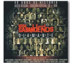
Diamante heißt die CD+DVD zum 40-jährigen Jubiläum der berühmten Los Sabandeños

Konzert Los Sabandeños. Auditorium von Teneriffa in Santa Cruz um 20.30 Uhr